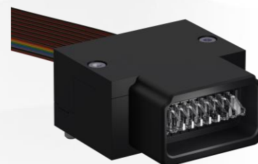
Abbildung 3: ODU BACKPLANE nach VITA 96.1 verbindet bis zu 96 Glasfasern.

Für detaillierte Informationen rund um das neue Portfolio sowie eine digitale Version besuchen Sie odu-aerospace.com .