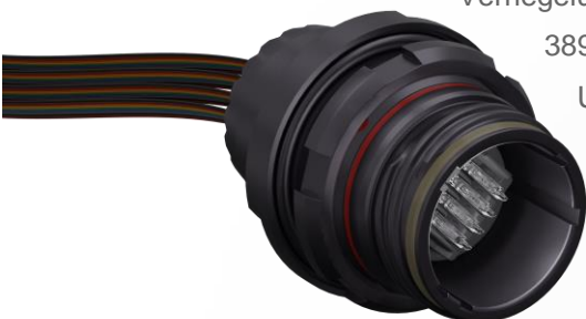
Abbildung 2: AMC Serie T Lösungen als State-of-the-Art Verbindung.

Die Alternative zum standardisierten MIL-DTL-38999, Serie III Steckverbinder überzeugt durch ein innovatives Verriegelungsprinzip und einen kleineren Außendurchmesser. Qualifiziert auf Basis des 38999 Teststandards, erfüllt die Linie alle Anforderungen zum Einsatz in extremen Umgebungen und punktet dabei mit geringerem Gewicht und kleinerem Formfaktor. Kupplungen sind hier im gewohnten Vierkantflansch-Design, aber auch als Jam-Nut-Variante erhältlich. Die Systeme ermöglichen eine sichere Verbindung über mindestens 5.000 Steckzyklen, ohne dass eine Reinigung erfolgen muss.